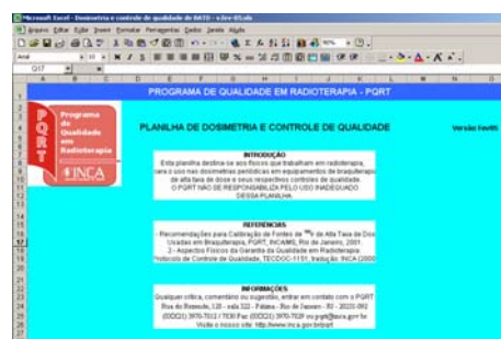
Figura 1 - Introdução

O arquivo completo é composto de apenas duas planilhas. A primeira é apenas uma introdução onde constam também as referências, a versão e os créditos (figura 1). A segunda