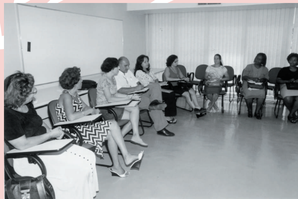
Voluntários que participaram do último recrutamento de agosto no processo de seleção

O novo recrutamento de voluntários acontece entre 10 de março e 4 de abril. Após o cadastramento, os candidatos assistirão a palestras sobre o INCA e o papel e a filosofia do INCAvoluntário. Na ocasião, serão apresentadas as atividades disponíveis, como apoio administrativo, apoio nas enfermarias e na recepção de pacientes. Também serão apresentadas as atividades em novos projetos como