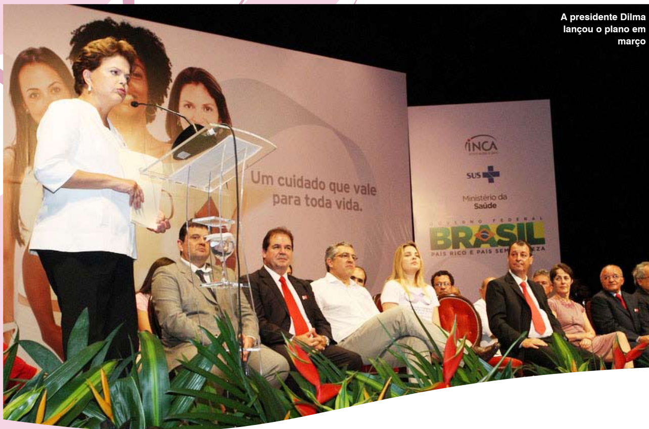
A presidente Dilma lançou o plano em março