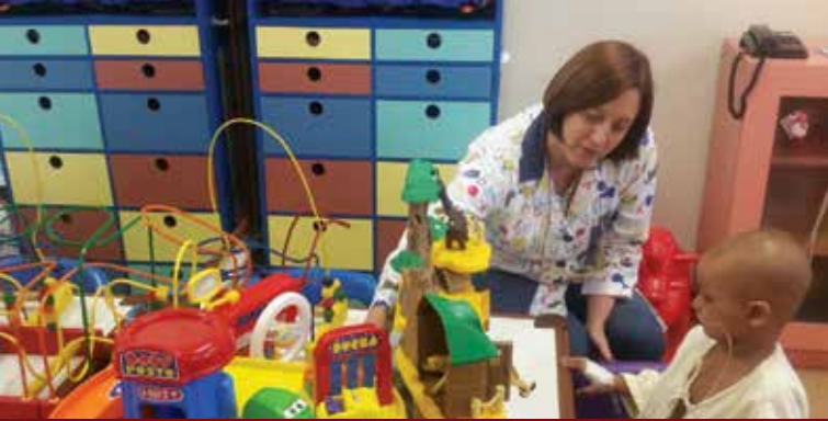
INCA: na brinquedoteca ou no leito, estímulo ao brincar