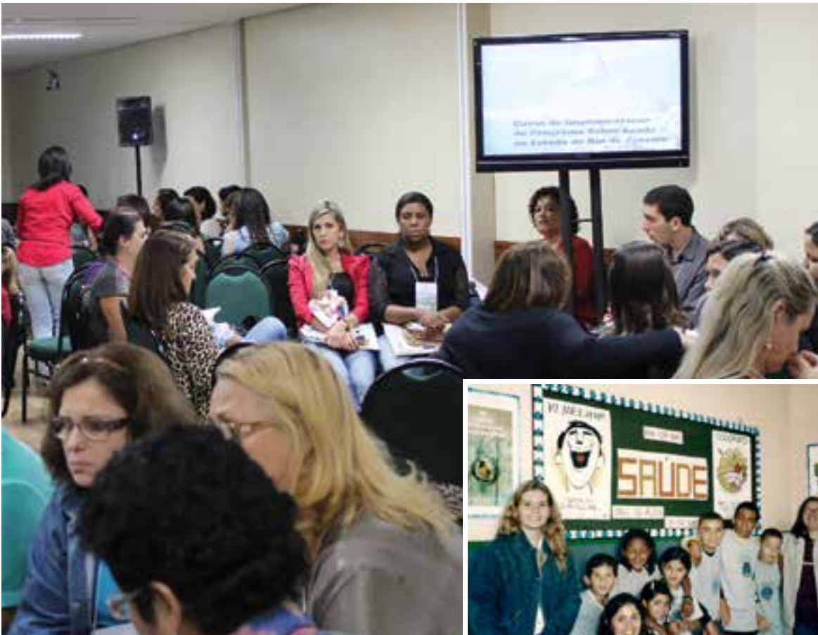
Acima, capacitação do Saber Saúde no Rio de Janeiro, em 2014. Ao lado, ação em escola municipal de Petrópolis (RJ), em 2003

“Nosso objetivo é levar uma informação diferente – a conscientização da importância da prevenção, de ações que podem impedir a iniciação ao fumo. Sabemos que o tabagismo é uma doença pediátrica, os jovens começam a fumar cada vez mais cedo, e a informação dentro do colégio é uma grande aliada”