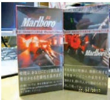
Figura 6 - Embalagem de Marlboro, edição limitada Fórmula 1

Nessa mesma linha de exploração das embalagens como peça de marketing , são vários os exemplos em que as próprias embalagens são usadas para promover esportes, corridas de Fórmula 1, eventos de artes e eventos noturnos que têm um grande apelo para os jovens 50 (Figuras 6, 7 e 8).