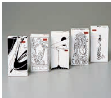
Figura 7 - Embalagem de cigarro, edição limitada Art Nouveau 54