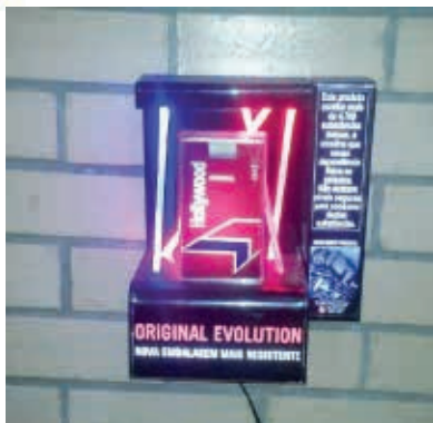
Figura 14 - Exemplo de exibição das embalagens de cigarro de forma destacada em ponto de venda no Brasil