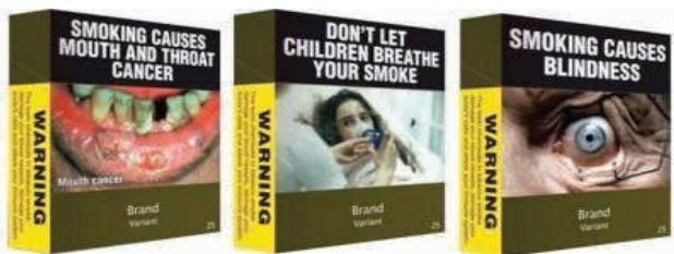
Figura 1 - Exemplos de embalagens padronizadas da Austrália