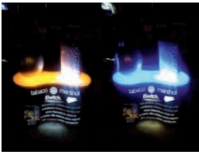
Figura 12 - Publicidade com alternância de cor na iluminação do Free iSwitch no Rio de Janeiro, 2013