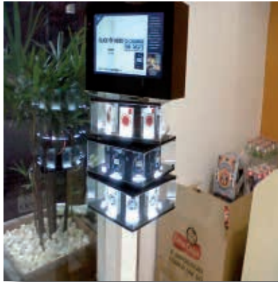
Figura 11 - Expositores de embalagens como forma de propaganda de cigarros no Brasil