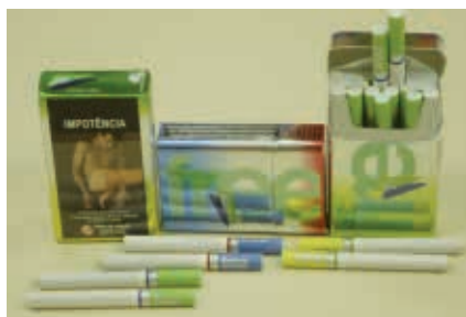
Figura 9 - Cigarros da marca Free de filtros coloridos em embalagens metálicas coloridas em tons néons

As figuras a seguir (9, 10, 11, 12, 13, 14, 15) ilustram as inovações nas embalagens de cigarros e seu posicionamento em pontos de venda no Brasil.