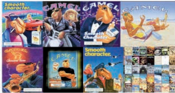
Figura 5 – Embalagens e propagandas da marca Camel com o personagem Joe Camel

aproximadamente a mesma proporção de crianças que era capaz de relacionar o personagem Mickey Mouse com o logotipo do Disney Channel. A Figura 5 52 mostra vários exemplos de propagandas utilizadas para promover a marca Camel, nas quais as embalagens aparecem ao lado do personagem Joe Camel em diferentes situações desejadas pelos jovens.