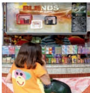
Figura 10 - Ponto de venda no Brasil: publicidade de cigarros junto a produtos voltados para as crianças