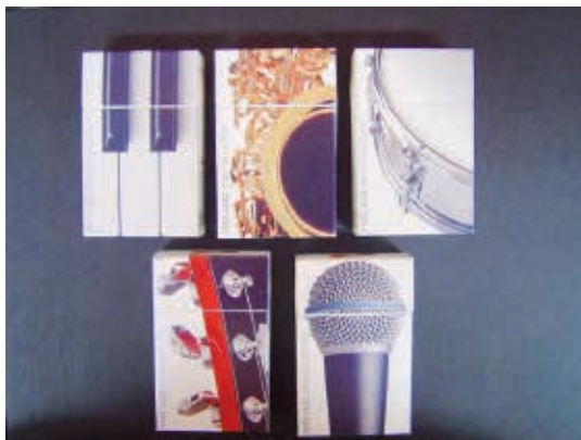
Figura 8 - Embalagens de cigarros associadas ao Free Jazz Festival, evento cultural realizado no Brasil até os anos 1990