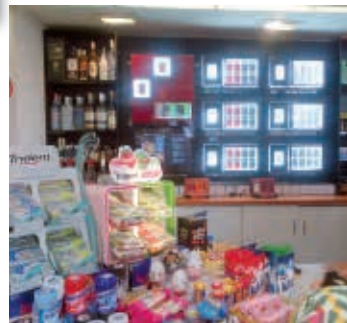
Figura 13 - Ponto de venda com exposição destacada dos maços em loja de conveniência no Brasil