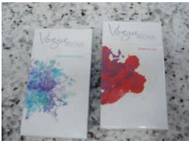
Figura 4 - Exemplo de embalagem de cigarro voltada para o público feminino

Da mesma forma, há pesquisas desenvolvendo embalagens para mulheres, gerando maços em formato slim , long packs , traduzindo a associação entre fumar e uma silhueta esbelta, e em tons de cores e ilustrações que promovem uma percepção de sofisticação e feminilidade (figura 4). Um relatório de pesquisa da Philip Morris observa que “algumas mulheres admitem comprar Virginia Slims, Benson and Hedges etc. quando elas saem à noite, para complementar um desejo de parecerem mais femininas e com estilo” 51 .