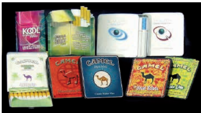
Figura 3 - Exemplo de embalagens de cigarros direcionadas para jovens.

XIX. Entre inúmeras pesquisas realizadas pela indústria do tabaco, há como exemplo o relatório de marketing da Philip Morris demonstrando a preocupação com a percepção dos consumidores, sobretudo jovens, das embalagens como antigas ou fora de moda (Figura 3). “Quando expostos às inovações, sobretudo os jovens adultos percebem suas embalagens atuais como embalagens superadas e entediantes”. O documento observa que o valor da novidade em embalagens é que “traz atenção e inveja de outros [consumidores] e que [...] especialmente consumidores jovens adultos estão prontos para mudar de embalagens” 49 .