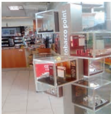
Figura 15 - Expositores de produtos de tabaco em altura compatível com a de uma criança em loja de conveniência no Rio de Janeiro, Brasil